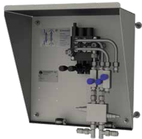
Steuerungseinheit MSE PRO