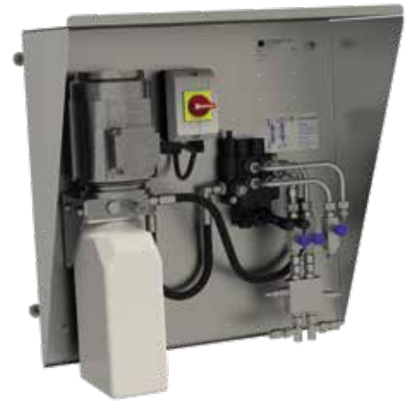
Hydrauliksteuerungseinheit MSE PRO