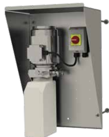
Hydraulikeinheit MSE PRO